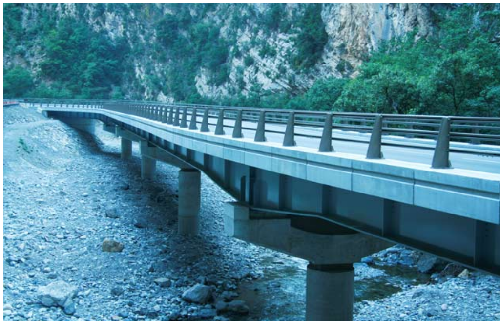
Photo du pont des Batteries dans la vallée de la Tinée Alpes Maritimes

<< telechargez notre plaquette de présentation >>