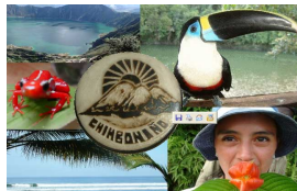
Agence Chimbonino Equateur