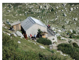
refuge de d'uscioiu

Période : de mai à octobre Temps : 09:00:00 Navette : Non Longueur : 17 m ou km Dénivelé-plus : 806 m Dénivelé-moins : 1000 m Référence carte IGN : 4253ET et 4253OT